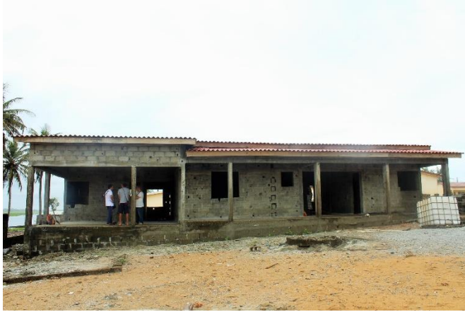
Dispensario en Azzuretti (Proyecto Ananda). En proceso de construcción.