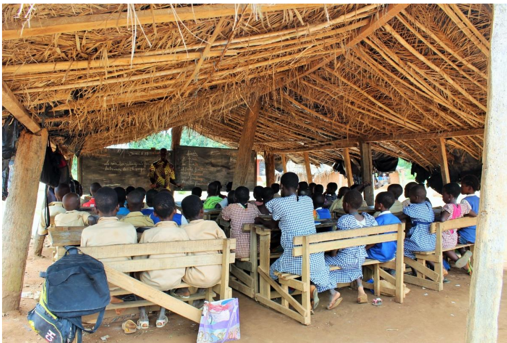
Daloa. (Proyecto Global Humanitaria). Centro Escolar donde numerosos niños recorren varios kilómetros para poder asistir a dicho centro.